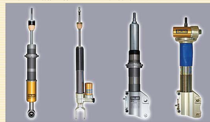
正立タイプ ¥12,000(税別)～ 正立タイプ 別タンク付 ¥13,000(税別)～ 倒立タイプ ¥16,000(税別)～ 倒立タイプ 別タンク付 ¥18,000(税別)～

オーリンズ ショックアブソーバーは様々な形状があります。車種ごとに採用されている形状が異なり、車種によっては前後で形状の異なる場合があります。ショックアブソーバーの形状によって、オーバーホールの費用(工賃・基本部品パック)がそれぞれ異なりますので、お客様がお持ちのショックをよくご確認ください。