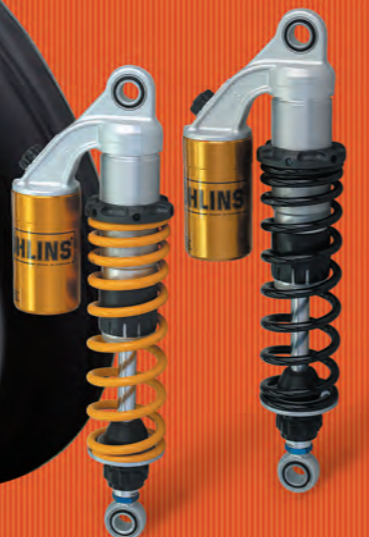
● ● LEGEND TWIN

すべての調整機構を備えた 最新のフルアジャスタブルショック。 スプリングは2色設定