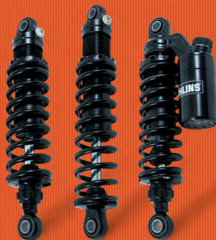
● ● ● TYPE S36DR1L TYPE S36D/E TYPE S36PR1C1L