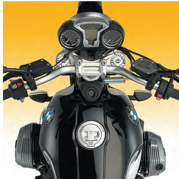
BMW R nine T +SD 044 +FGRT 218